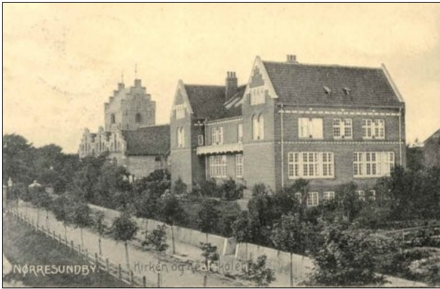
Realskolen anno ca. 1910