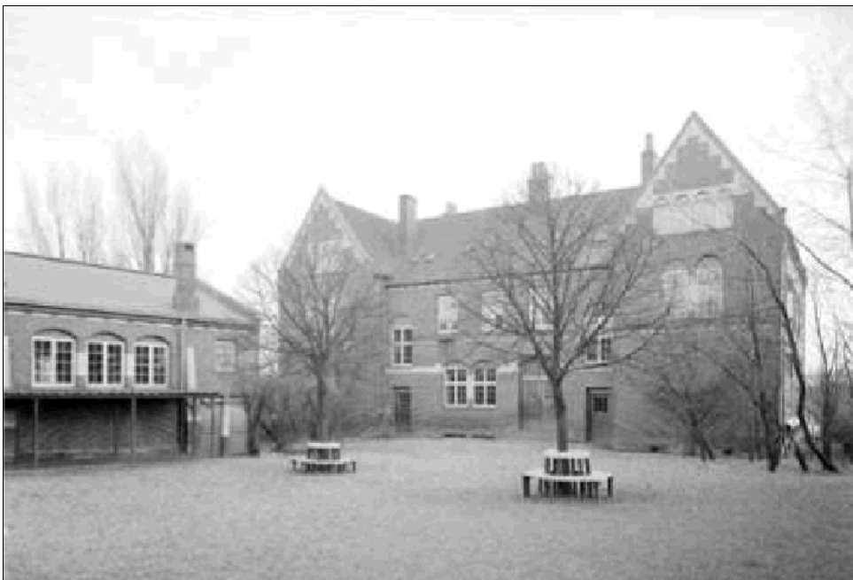
15. april 1921