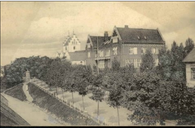
Realskolen anno ca. 1913