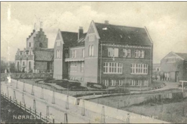
Realskolen anno 1903

Dette er sandsynligvis det første billede, der er taget af Nørresundby Mellem- og Realskole. - Læg mærke til at kirketårnet i baggrunden endnu ikke har fået takker på taget.