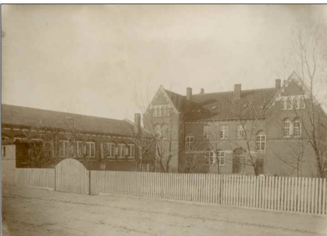
Den gamle Realskole set fra Nørregade - i dag Sct. Pedersgade.

Læg mærke til de mange skorstene, den store indgangsdør (hvor sekretæren har kontor i dag, og hvor skolelederen tidligere havde kontor), de mange træer i skolegården og det prangende, hvide stakit.