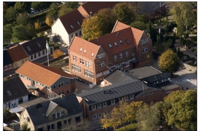
Billede af Solsideskolen som den ser ud i dag med vores nyeste bygning "Solsikken"